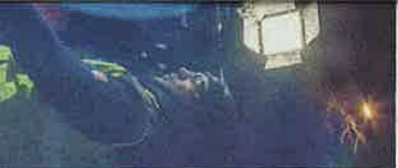
Schulze zeigt einem Unfall